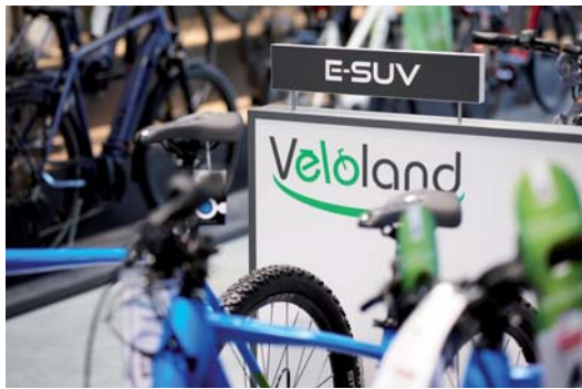
Das Veloland-Konzept erfüllt die Richtlinien des deutschen Franchiseverbandes.

Thürheimer: Das Veloland-System bietet vor allem viele unternehmerische Freiräume. Die Pflichten sind überschaubar, natürlich muss beispielsweise das Corporate Design entsprechend der festgelegten Richtlinien eingehalten werden. Da wir dem Thema Service einen sehr hohen Stellenwert einräumen ist zudem die Zer-