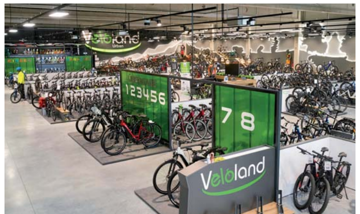
Veloland bietet ein modernes Corporate Design.

Weitere Vorteile ergeben sich aus dem bereits beschriebenen Corporate Design der Marke Veloland sowie dem umfassenden Betreuungskonzept für die Franchisenehmer. Dieses umfasst alle unternehmerischen Bereiche wie zum Beispiel Unterstützung bei der Erstellung eines Businessplans, bei Finanzierungsfragen, im